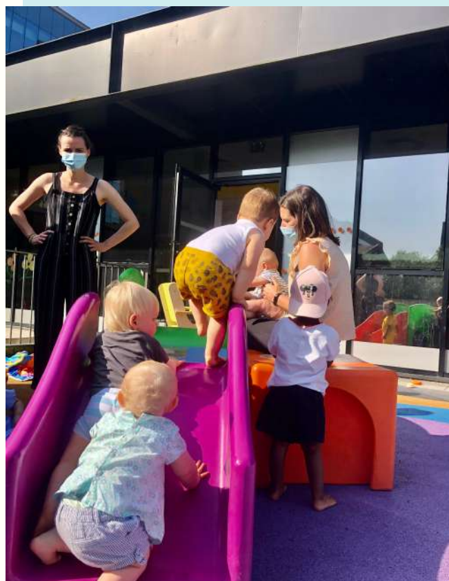
La crèche Enfant'aisy accueille jusqu'à 42 enfants par jour

Ainsi, l'association participe aux temps forts du pôle, s'implique dans de nouveaux projets et prend part à l'interconnaissance des réseaux d'acteurs de l'ESS. Se rassembler autour d'intérêts communs pour avancer ensemble et développer l'économie sociale et solidaire, c'est aussi cela le sens de l'adhésion à RÉSO solidaire.