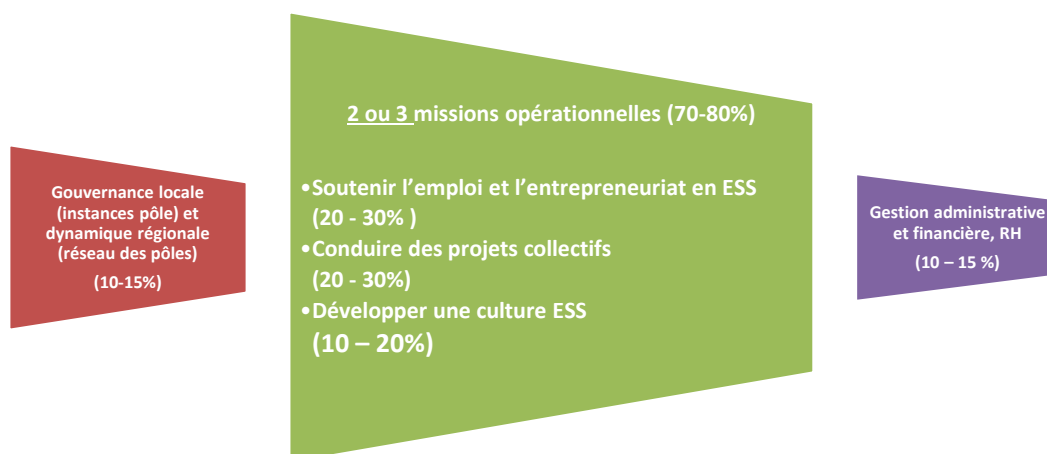
Schéma représentant la répartition du temps de travail pour la conduite des missions socles :

Ce financement socle peut être assuré par :